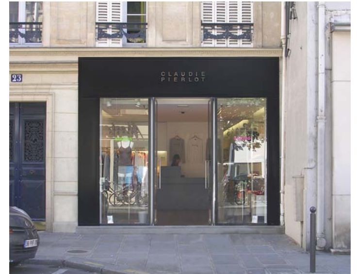
Vue de la boutique du Vieux Colombier