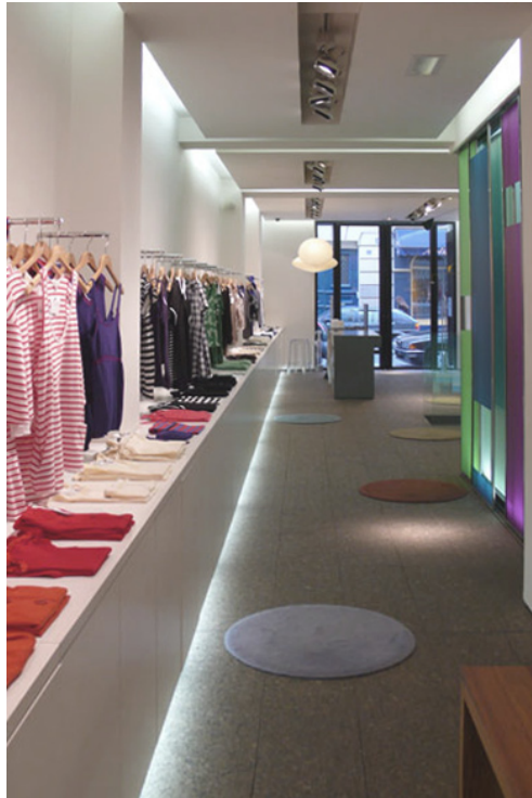
Vues de la boutique du 29 juillet