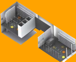
Axonométrie du Vieux Colombier